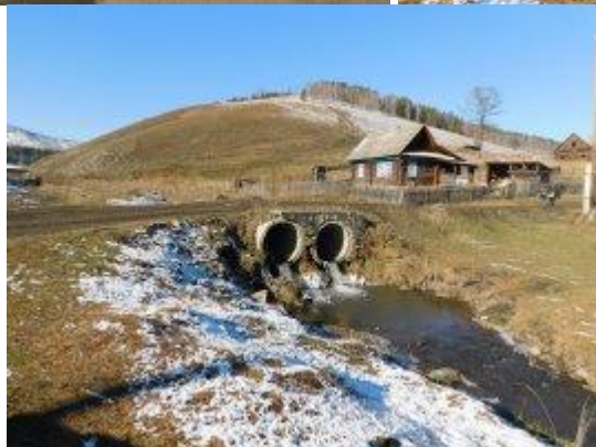
Рис. 6.- ул. Центральная (1,000 км) с. Бешпельтир Бешпельтирского сельского поселения