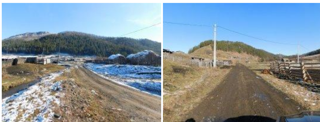
Рис. 2.- ул. Чичкинская (0,820 км) с. Бешпельтир Бешпельтирского сельского поселения