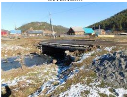
Рис. 7.- Автомобильный мост через р. Калбажак с. Бешпельтир Бешпельтирского сельского поселения (требуется строительство)