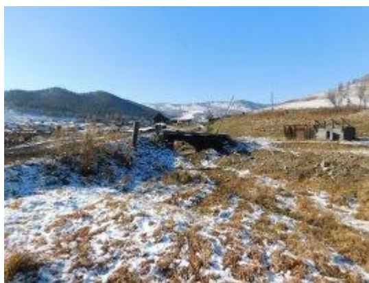
Рис. 9.- Автомобильный мост через р. Чичка на ул. Чичкинская с. Бешпельтир Бешпельтирского сельского поселения