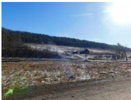
Рис. 5.- урочище Тиленчи (1,000 км) с. Бешпельтир Бешпельтирского сельского поселения