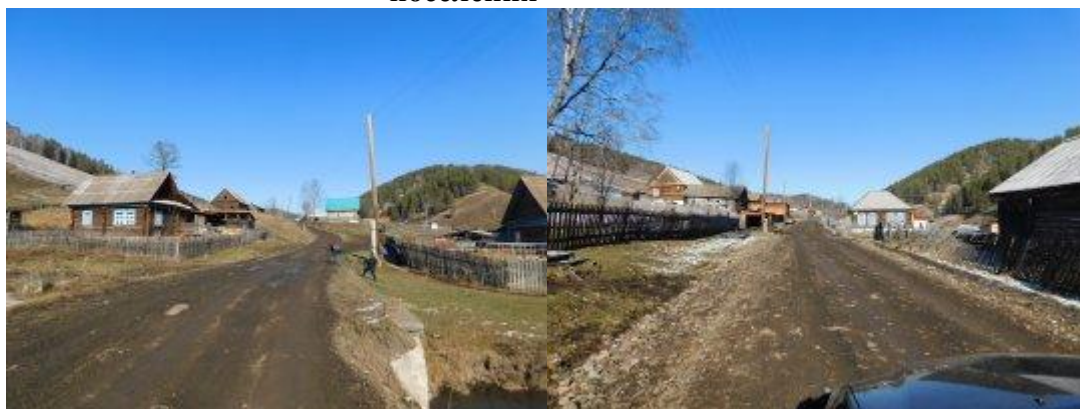
Рис. 3.- ул. Уйтушкенская (1,200 км) с. Бешпельтир Бешпельтирского сельского поселения