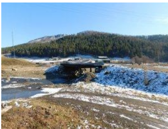
Рис. 8.- Автомобильный мост через р. Уйтушкен на ул. Чичкинская с. Бешпельтир Бешпельтирского сельского поселения